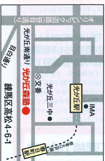
都営大江戸線：「光が丘」駅下車南へ直進徒歩6分。「春日町」駅下車西へ直進徒歩6分