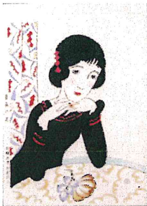
竹久夢二《番笺の花》